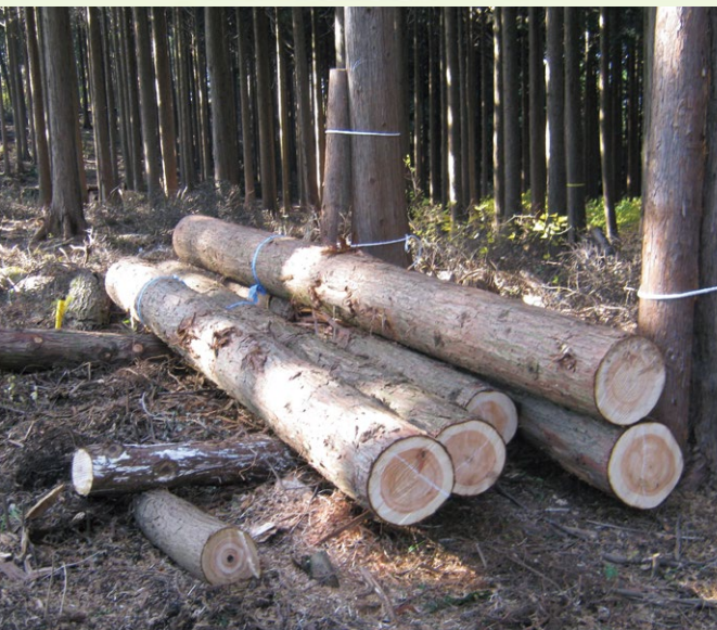
杉の丸太。建設用材として販売する事が、最も高額で取引されるので、環境整備に資金を廻しやすくなる。

植物が太陽の光を浴び、空気中の二酸化炭素（カーボン）と地中の水を取り込んで酸素を出すのが「光合成」です。「木」は成長しながら炭素を蓄えますが、老齢になると徐々に活発には光合成できなくなり、山で50年育った「木」を伐採し、それらを建築用材として50年以上使えばカーボンマイナス